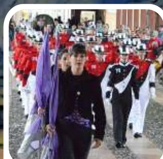
MOSSON DRUM & BUGLE CORPS