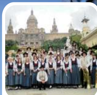
LA BANDA DI SAN LORENZO IN BANALE