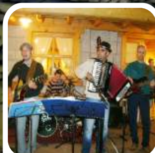
APERIQUARTET ACUOSTIC BAND