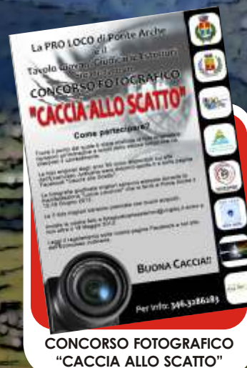
CONCORSO FOTOGRAFICO "CACCIA ALLO SCATTO"