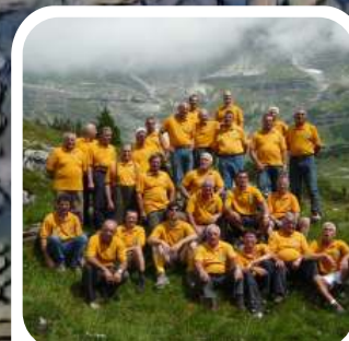
CORO CASTEL CAMPO