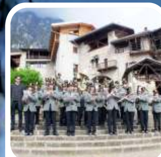
LA BANDA INTERCOMUNALE DEL BLEGGIO